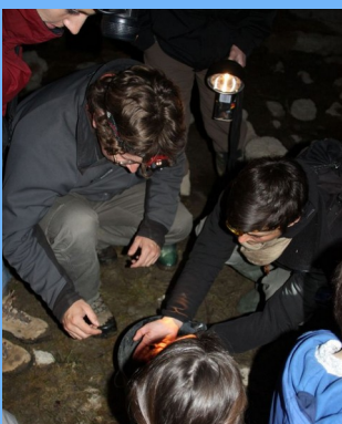
Observation des amphibiens