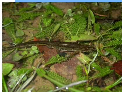
Triton palmé