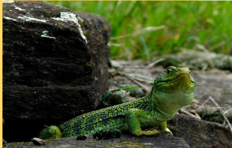
Lézard ocellé @C. Sabran