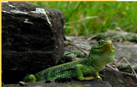
Lézard ocellé

Le Centre Ornithologique du Gard (COGard) et les Ecologistes de l'Euzière (EE) inventorient la biodiversité de la commune de Belvezet. La commune s'inscrit dans une volonté plus générale de concilier, sur son territoire nature, écologie et occupation humaine. Belvezet est une commune ayant une forte sensibilité écologique et qui a pour volonté de limiter les intrants chimiques sur son territoire, de favoriser une agriculture biologique et de proximité et de conserver la qualité de son environnement et de ses paysages. Les premiers inventaires en 2021 permettent de faire un état des lieux des connaissances mais en 2022 nous comptons sur les habitants et acteurs du territoire pour participer à l'inventaire de leur commune.