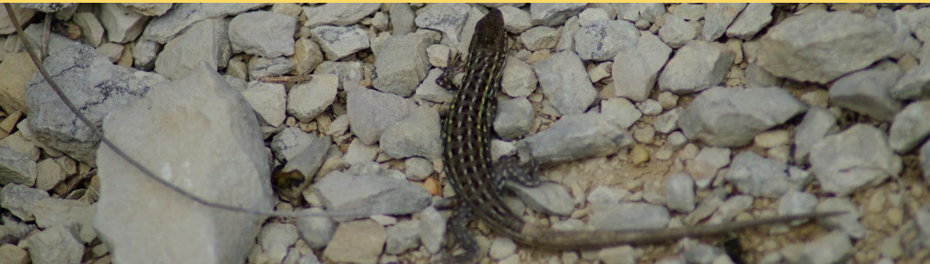
Psammodrome d'Edward

Le Centre Ornithologique du Gard (COGard) et les Ecologistes de l'Euzière (EE) inventorient la biodiversité de la commune de Belvezet. La commune s'inscrit dans une volonté plus générale de concilier, sur son territoire nature, écologie et occupation humaine. Belvezet est une commune ayant une forte sensibilité écologique et qui a pour volonté de limiter les intrants chimiques sur son territoire, de favoriser une agriculture biologique et de proximité et de conserver la qualité de son environnement et de ses paysages. Les premiers inventaires en 2021 permettent de faire un état des lieux des connaissances mais en 2022 nous comptons sur les habitants et acteurs du territoire pour participer à l'inventaire de leur commune.