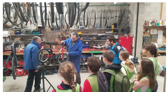
Archéologie : Massargues, cité médiévale, se dévoile

Société - Publié le 21 juillet 2022 à 09h00, par Alban Laffitte